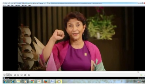
Scene 24: Menteri Kelautan dan Perikanan Indonesia, Susi Pudjiastuti menyampaikan pesan "Mari makan ikan! Makan Ikan, Sehat! Dan... Pintar!!"

Pudjiastuti. Berikut cuplikan scenenya :