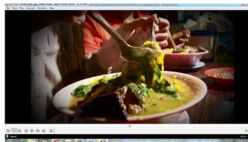
Scene 15: Zoom in makanan olahan ikan yang sedang disantap oleh dua pembeli di sebuah warung makan

Sebanyak 62% responden menyetujui bahwa video dengan gambar hasil tangkapan ikan segar dari sekumpulan nelayan dan sebuah keluarga yang sedang asyik makan iklan bersama-sama. Tampak keluarga yang terdiri dari seorang ayah, dua orang ibu usia paruh baya dengan tiga orang anak sedang asyik makan bersama