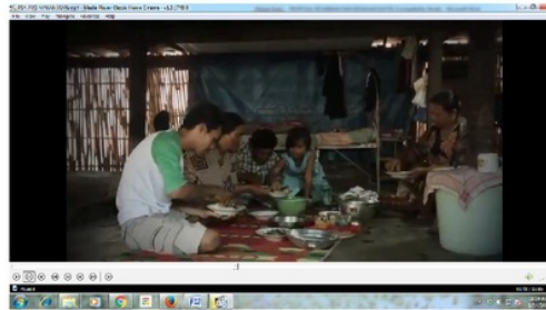
Scene 11: Tampak keluarga yang terdiri dari seorang ayah, dua orang ibu usia paruh baya dengan tiga orang anak sedang asyik makan bersama

Sementara itu gambar lain menunjukkan keluarga.