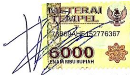
Raymundus Aprianto Prabowo

Surabaya, 4 November 2019 Yang membuat pernyataan,