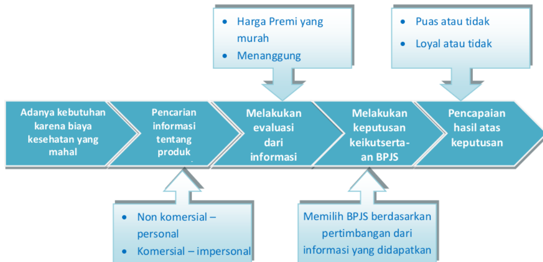
Bagan 1. Model Proses Pengambilan Keputusan Keikutsertaan Asuransi BPJS sebagai Asuransi kesehatan keluarga

asuransi BPJS sebagai penjamin kesejahteraan kesehatan keluarga adalah sebagai berikut :